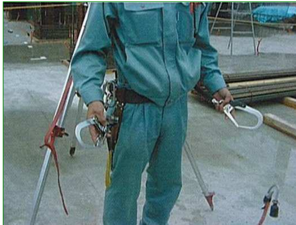
2丁掛け安全带を着用した姿