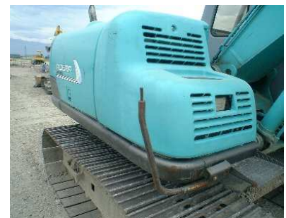
↑ミラーの壊れたバックホウ