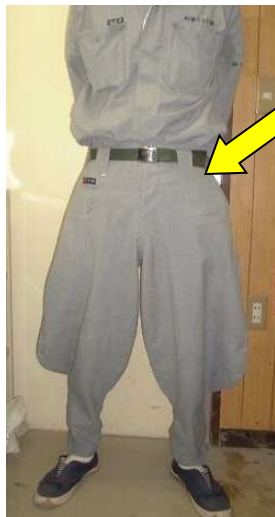
巾広ズボンの作業服

作業性、安全性において「7分作業ズボン」が優れている ことは言うまでも無いです。