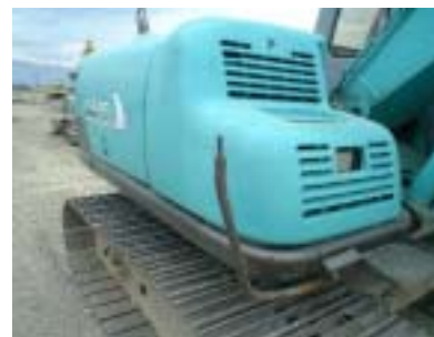
ミラーの壊れたバックホウ