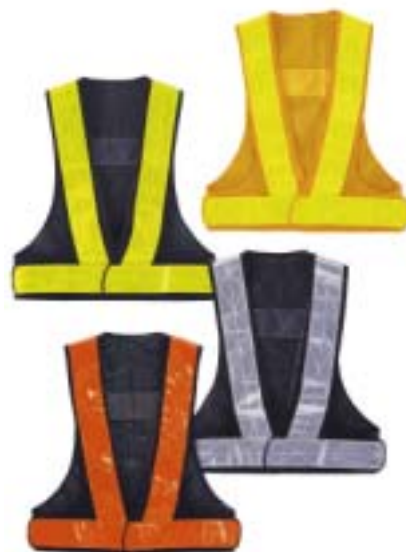
反射チョッキ:市価1000~3000円

作業によっては作業者が 旋回範囲に立ち入る場合も あります 作業場所の条件によっては 雨、夕暮れ、雪など 視界に支障を及ぼす場合も あります 作業者がオペレータから 視認しやすい服装である 必要があります